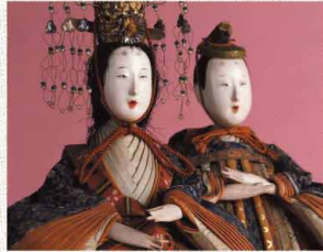
亨保雛 鎌倉国宝館蔵