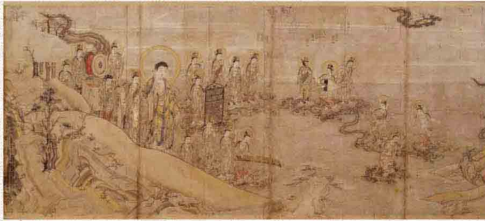
国宝 当麻曼茶羅縁起絵巻(光明寺蔵)

12日(土)～12月1日(日) 鎌倉市制80周年記念特別展 「名宝巡礼—古都鎌倉の祈りのかたち—」