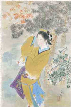
『空母松』 昭和40年(1965)頃 同館蔵