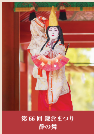
第66回 鎌倉まつり 静の舞

その舞台で静は 「よしの山 峰の白雪ふみ分けて いろにし人のあとぞこいしき」 「しづやしづ しづのをだまきりかえし 昔を今に なすよしもがな」