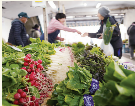
レンバイで新鮮な野菜を買うのも楽しみのひとつ