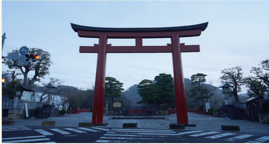
鶴岡八幡宮の朝まわりは清々しい気持ちになります。