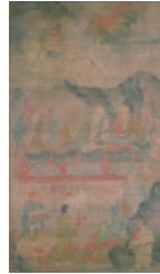
国指定重要文化財 「五百羅漢図」