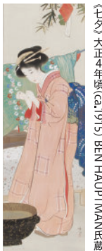
〔中〕大正4年頃(ca.1915)