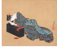
《酔余美人図(葛飾北斎筆) (公財) 一家浮世絵 コレクション所蔵