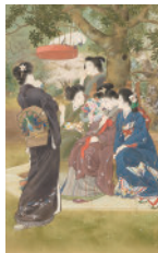
《嫁ぐ人》 明治40年(1907) 同館蔵